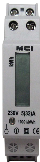
CONTAX 32A à afficheur LCD Code article : 031001

Tolérance de l'humidité de l'air : moyenne 75%, courte durée 95%.