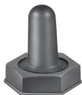
Capuchon d'étanchéité voir page 48

Inverseur plot mort avec 2 positions momentanées Fonction : MOM - OFF - MOM